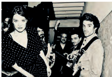
SPACE AGE SUNSET